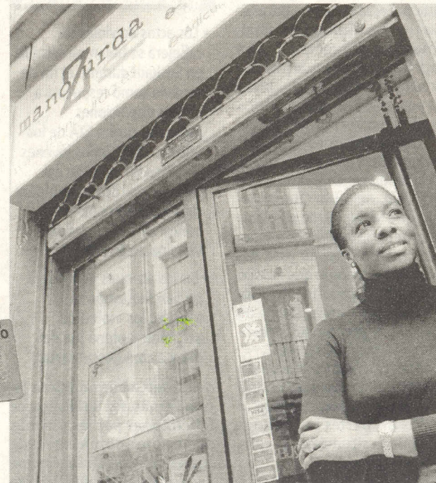
IMÁGENES: JOSÉ HARO

MANOZURDA puede encontrarse también en Internet: www.manozurda.es .